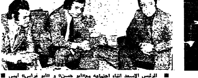
الرئيس الاسعد وسلام اثناء اجتماعهما امس امس

حول ترشيحه لتشكيل حكومة جديدة «انا لست بهذا الوارد»، فاقطعه الرئيس الاسعد قائلاً: هناك مصلحة وطنية تقتضي بحمل المسؤولية نسي الظروف الراعبة. وقال الرئيس الاسعد بعد الاجتماع: ان الوضع اللبناني والوضع العربي بصورة عامة يقتضي ويغرض التشاور من اجل العمل المسؤول المشترك باسم المسؤولية ووجودنا مع صلب يسك ما هو الا نعين من هذا الواقع - نحن الان يمكننا بحث وضع الحكومة ما دامت موجودة ولكن كل اقتراضي بالنسبة لعمل يترد لصحة البلد، وعلى البنية على الصفحة ١٢ - عمود ٢